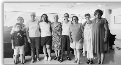
Las chicas de la Agrupación Coral de Yebes

17.00 horas. Día de la bicicleta. Salimos de la plaza María Cristina hasta el Observatorio y vuelta.